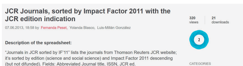
Figura 2. Métricas de un dataset depositado en Figshare.

< https://figshare.com/articles/JCR_Journals_sorted_by_Impact_Factor_2011_with_the_JCR_edition_indication/714141 >.